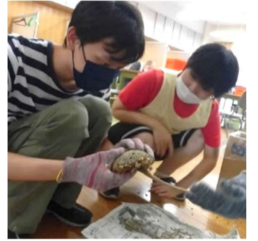
ひまわりの種取り