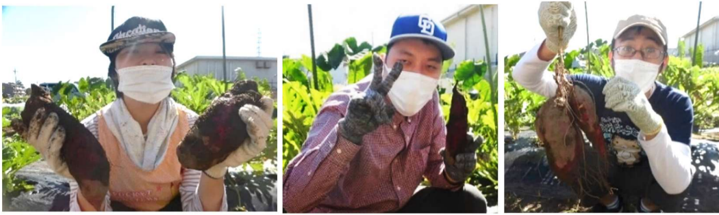
さわやかな初秋の空をみあげつつ、芋ほりをさせていただきました。 土の中からどんどんお芋さんが出てくるのを一生懸命掘りました。